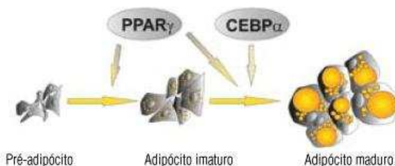
Figura 2: Modelo simplificado da adipogênese