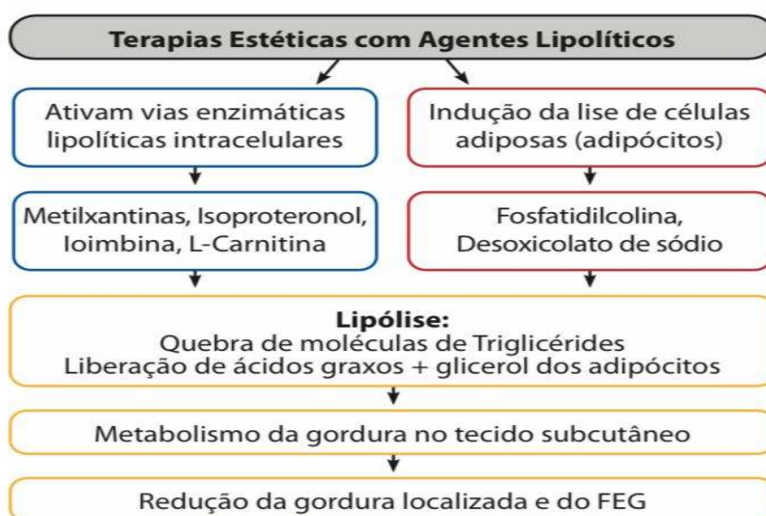
Figura 4: Representação esquemática dos principais efeitos do uso dos agentes lipolíticos mais empregados no tratamento estético para a Adiposidade Localizada e Fibro Edema Geloide (FEG) ou Lipodistrofia Ginoide (LG).

Entre os diversos tratamentos disponíveis, para presente trabalho selecionou-se o fármaco fosfatidilcolina, por esta apresentar destaque no tratamento do distúrbio (Figura 4).