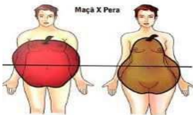
Figura 3: Biotipos clássicos: Androide (ou tipo maçã), Ginoide (ou tipo pêra)

A lipodistrofia localizada é uma patologia do tecido gorduroso, onde ocorre acúmulo da gordura em locais específicos. Segundo Brownell (1994), a lipodistrofia localizada do abdômen é chamada de gordura superior ou gordura androide, ocorrendo com maior frequência nos homens. A localização de gordura nestas regiões está associada com maior morbidade e mortalidade do que aquela gordura distribuída abaixo da cintura, principalmente localizada na região da pelve e coxa superior, denominada de gordura ginoide ou periférica, mais frequente em mulheres, como pode ser observado na Figura 3.