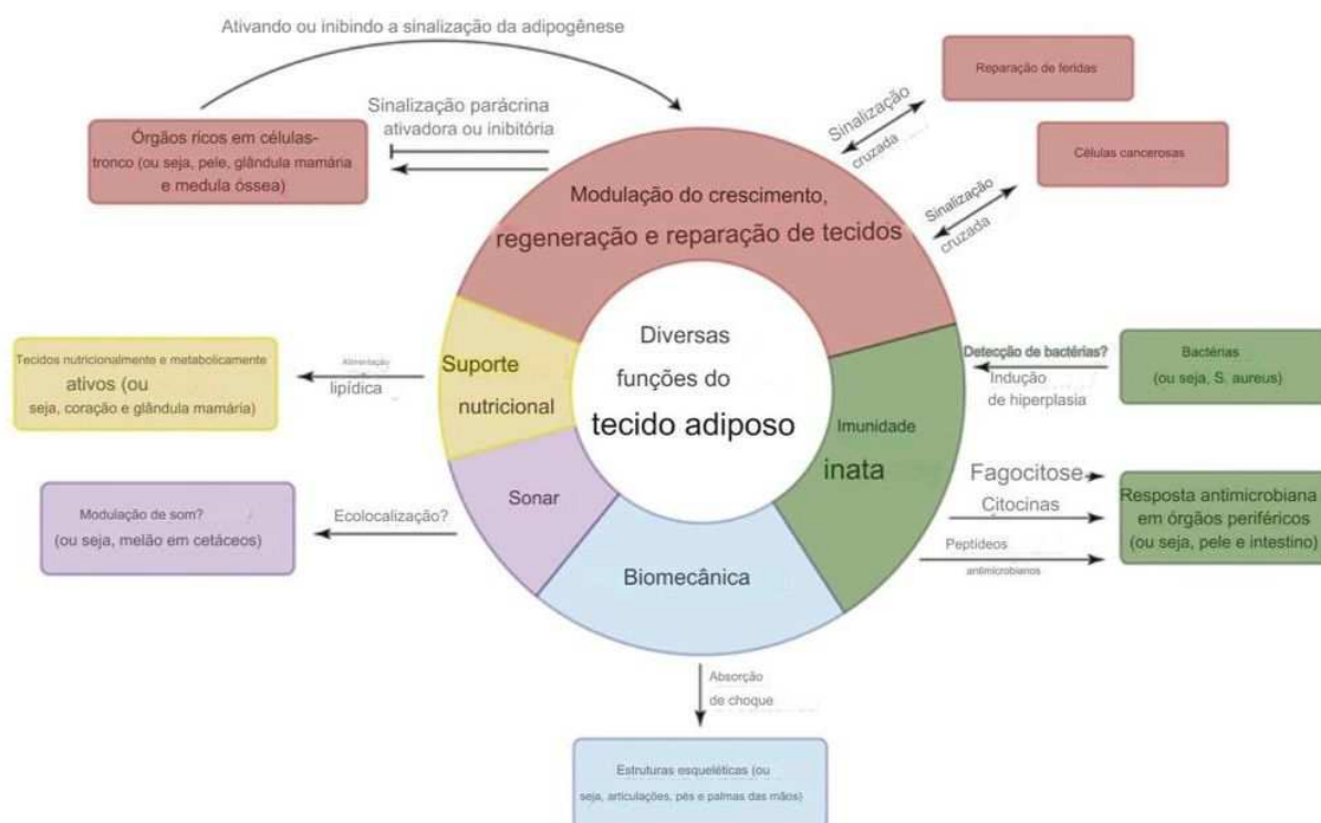
Figura 1: Funções do Tecido Adiposo.

O autor completa que o tecido TAB armazena os TAG (triacilglicérides), ao passo que o TAM produz calor (Termogênese). E ainda destaca que, os tecidos se diferem pela sua quantidade no organismo, cor, vascularização, número de organelas, atividade metabólica, e distribuição no organismo (Curi, 2002). A Figura 1 demonstra as diversas funções do tecido adiposo, abordadas acima.